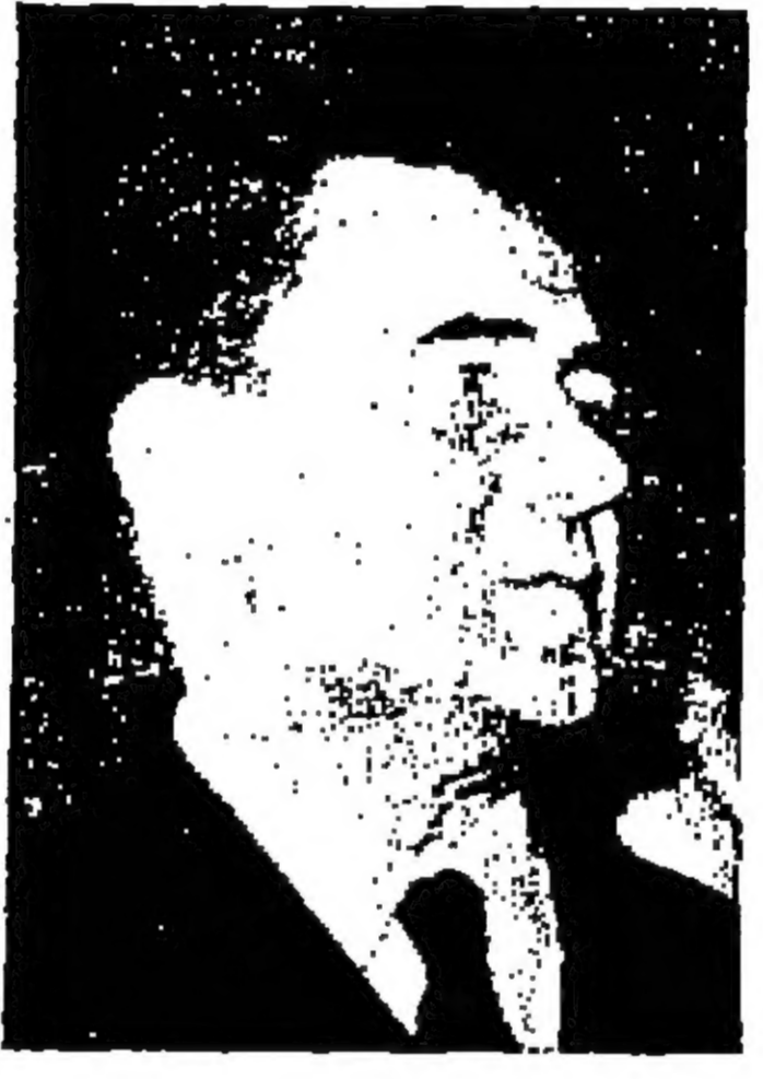
الرائسية . نرى ام لا تصريف الطريقة التي تقول انها ستستمر بها . ونصف المجر غروميكو يقول ان بلاده كثيرا ما اهدرت من استعدادها للاحتفال بعلاقات طيبة مع الولايات المتحدة .

« وقال ان فريق ماو تسي تونغ يسير في طريق تدري الى تدهور العلاقات ويضع سياسة حذرة وتقع ازا حوقنا . وأشار الى ان راديو بكين وصفتها اكثر عداء للسوفيات من الدعاية التعمارية . وقال ان سياسة بكين الخارجية حذرة ومخوفة وتتميز بالغمارة